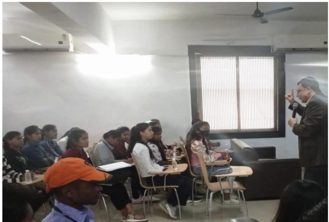
Academic visit and interaction with Vice Chancellor of Kalinga University Raipur